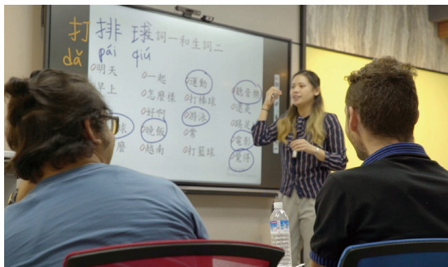
▼ 運用 ViewBoard 互動式電子白板，增加上課互動性

ViewSonic 複合教學教室以「實體、線上一視同仁」為核心概念，將線上教學完全融入實體教室，解決老師無法將遠距學生視為一般學生的問題。複合教學教室運用 ViewBoard 智慧互動電子白板、 myViewBoard 數位教育平台、投影機等硬體設備與軟體解決方案，老師可以在教室中同時看到教室內、遠端同步上課的學生，還能同步直播課程，與參與直播的學生直接對話。另外，透過教室後方投射的畫面，老師可以檢視自己上課的狀態與畫面，不用頻頻回頭看教室前方白板，可以更專注於課程內容及活動，維持課程的高度互動狀態。