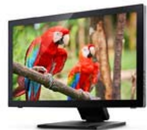
Full HD Resolution