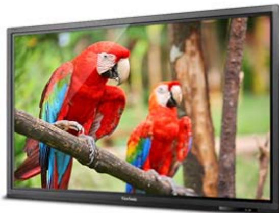
Full HD Resolution