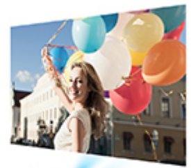
Conventional projectors offer low-quality images