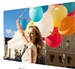
SuperColor™ projectors offer color accuracy levels

La technologie SuperColor™ de ViewSonic offre une gamme de couleurs plus large que les vidéoprojecteurs conventionnels. La conception exclusive de cercle chromatique et les fonctionnalités de réglage dynamique de la lampe permettent de projeter les images avec des performances couleur fiables, fidèles et précises. Le système SonicMode de ViewSonic produit également des performances audio optimisées pour différentes applications telles que la parole, la musique et les films.