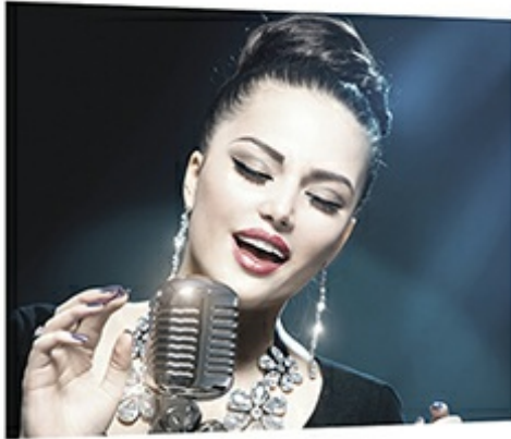
ViewMatch® Color Mode