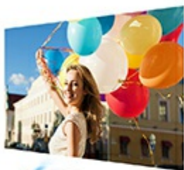
SuperColor™ projectors offer color accuracy levels