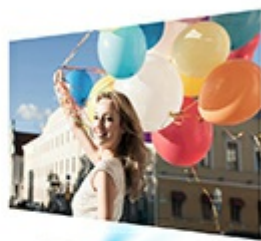
Conventional projectors offer low-quality images