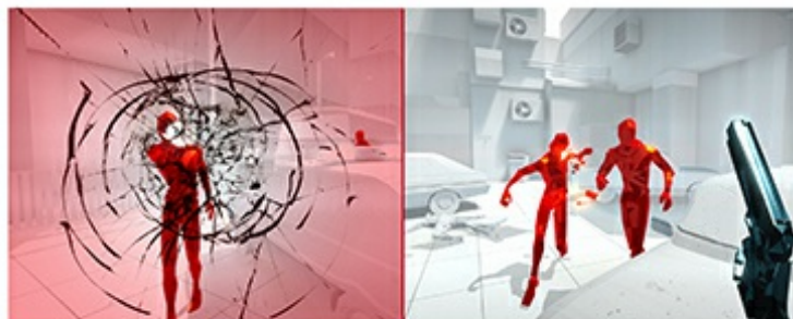
Low Input Lag OFF