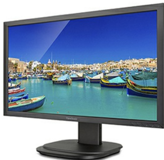
ViewSonic Flicker-Free Technology