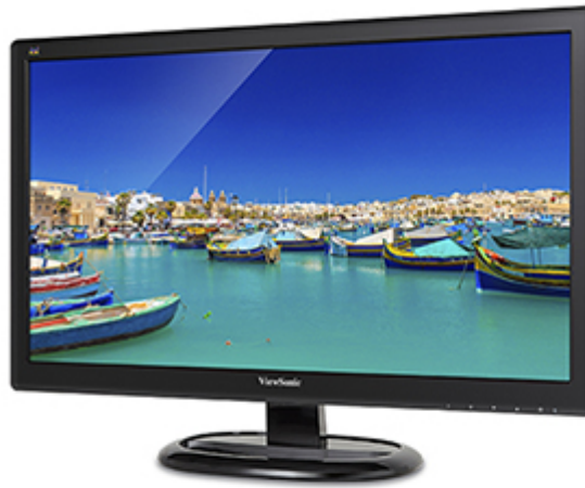
ViewSonic Flicker-Free Technology