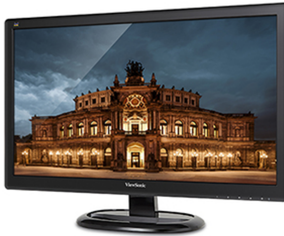
3000:1 Static Contrast Ratio