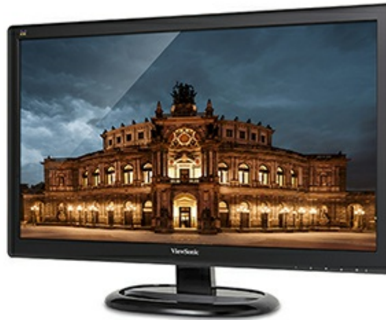
3000:1 Static Contrast Ratio