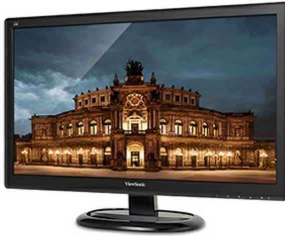
3000:1 Static Contrast Ratio