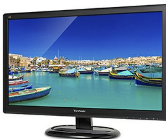
ViewSonic Flicker-Free Technology