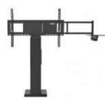
VB-STND-004 Elektrisch höhenverstellbarer Bodenstandfuß EAN 76690798341 8