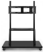
VB-STND-001 Rollwagen EAN 76690794761 8