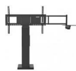
VB-STND-004 Elektrisch höhenverstellbarer Bodenstandfuß EAN 76690798341 8