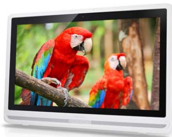
Full HD Resolution