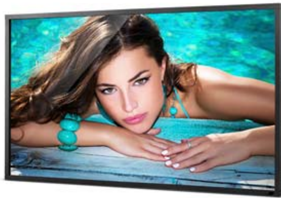
Full HD Resolution