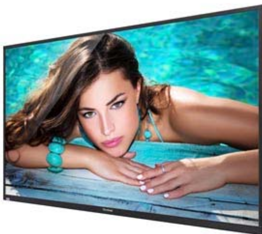
Full HD Resolution