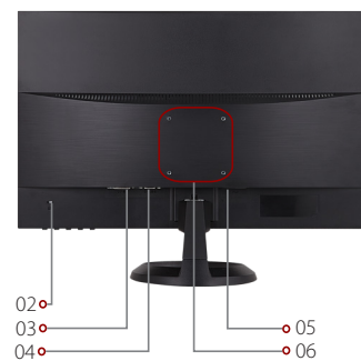
6. VESA®-Halterung 75 x 75 mm